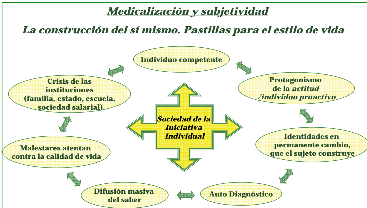
Gráfico 2. Sociedad de la iniciativa individual e individuo competente.