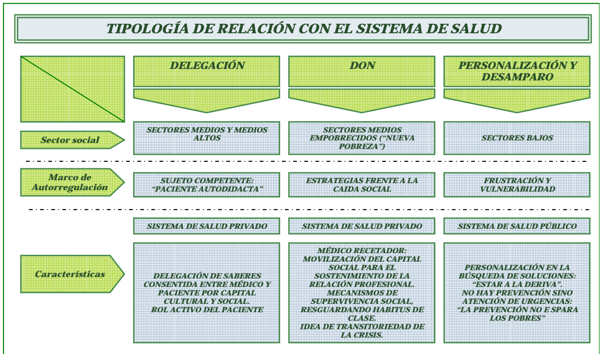
Gráfico 4. Tipología de relación con el sistema de salud.